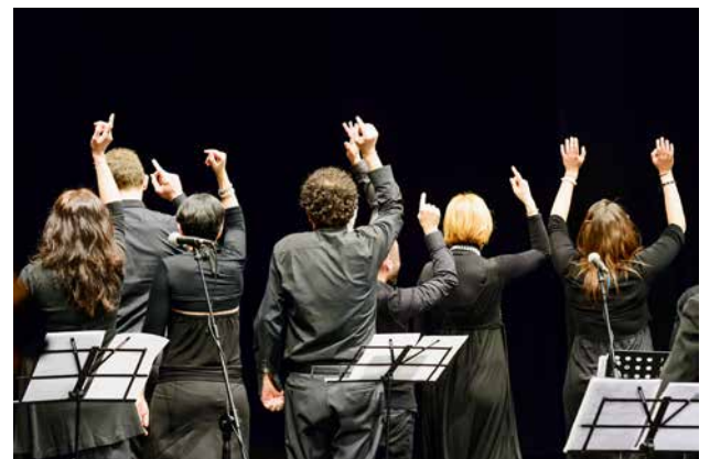
Wer macht mit beim einmaligen Kantaten-Projekt?