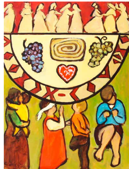
Weltgebetstag 2019 aus Slowenien.