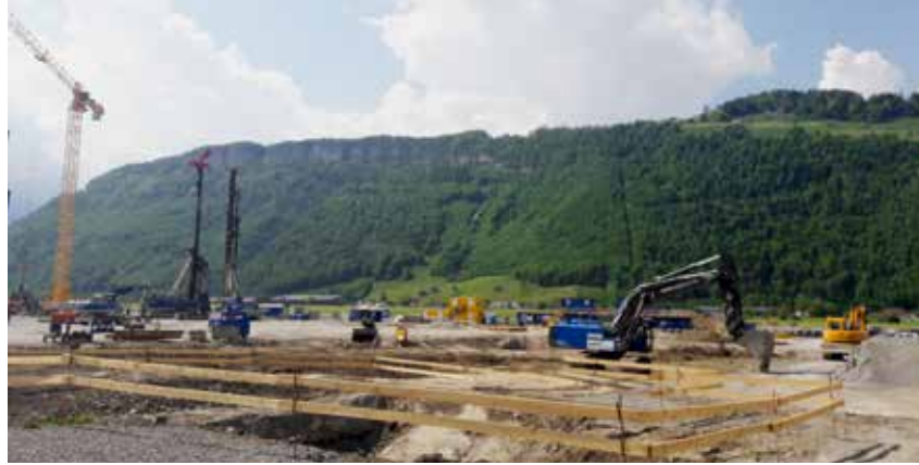
Baustelle zwischen Stans und Buochs.