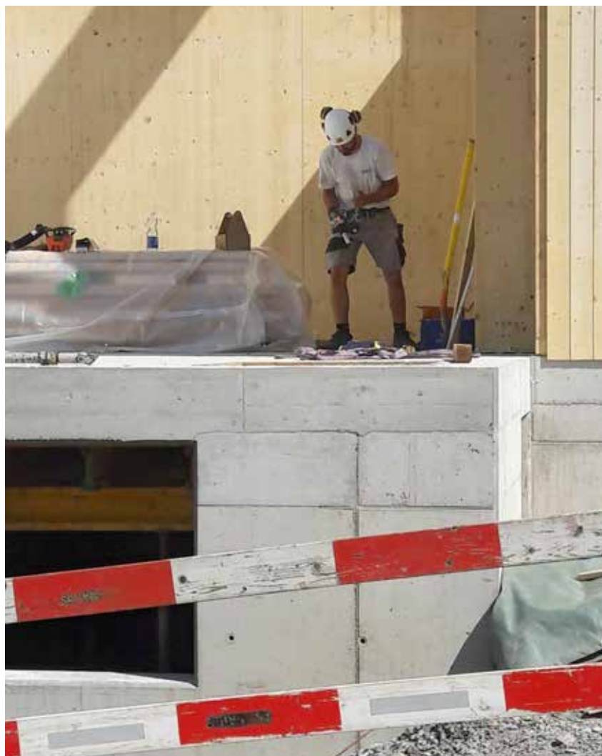
Die Auswahl der Baumaterialien ist entscheidend für Veränderungen auf der Baustelle.

Das Leben ist voller Baustellen. Manche sind abgründig, gefährlich, staubig und dreckig. Der Lärm vom Presslufthammer, Kran, Lastwagen und Bagger erfüllt zum Teil monatelang die Gegend. Man muss mit Umleitungen, Verzögerungen und Verspätungen rechnen. Doch wenn der Geist oder der «Spirit» eines Unternehmens stimmt, kann aus jeder Baustelle ein ansehnlicher Bau und eine dienliche Struktur werden.