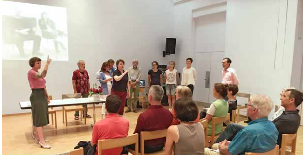
Gemeinsam gesungener Dialog mit dem Zámácho(r) an der Gründungsversammlung des Vereins Religionen im Dialog.