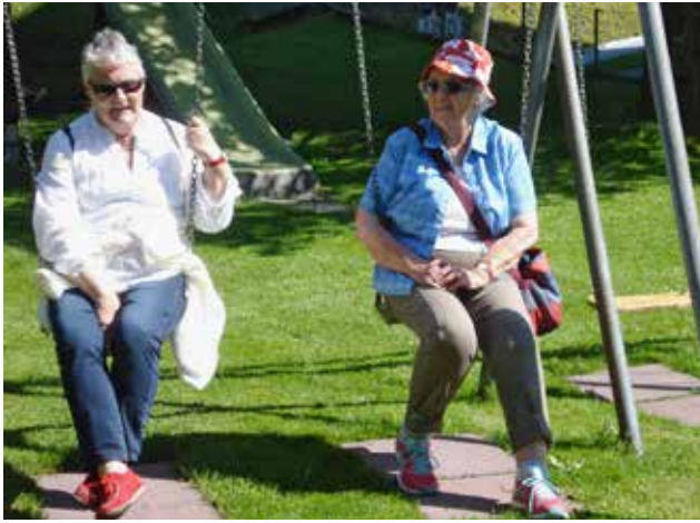
Reformierte Frauen aus Nidwalden unterwegs: gemütliche Pause beim Maibummel in Büren und angeregtes Zuhören beim Urner Wollhandwerk in Amsteg. Am 5. Juli geht's nach Meggen in den Schlossgarten.