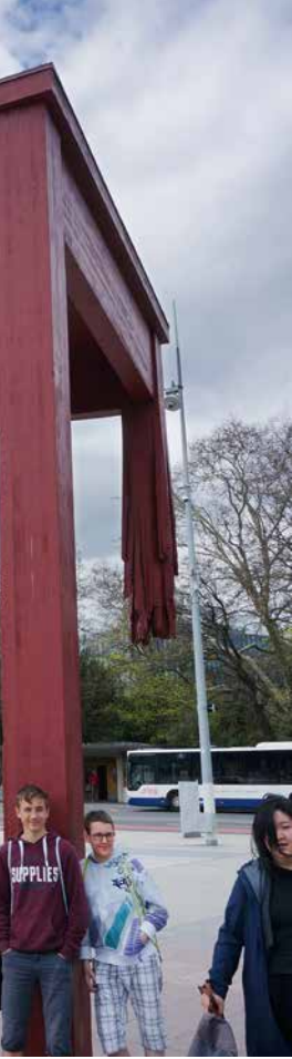
«chene Stuhl» –