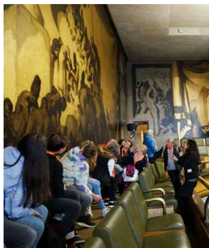
Empore eines Plenarsaals des UNO-Hauptgebäudes in Genf.