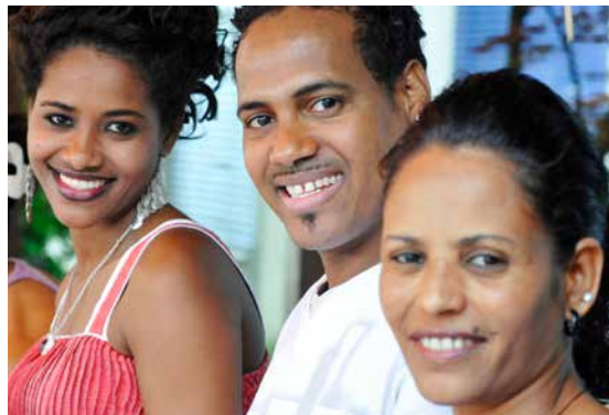
Stans: Samstag, 16. Juni, 10–14 Uhr, Begegnungsfest zum Internationalen Flüchtlingstag; bistro-interculturel.ch

Rechtzeitig zum Papstbesuch in der Schweiz kommt Mitte Juni ein Papst-Dokumentarfilm des Regisseurs Wim Wenders in die Kinos. Er gibt einen einfühlsamen Einblick in Franziskus' Ideen einer gerechteren Welt. Papst Franziskus wird am 21. Juni in Genf den Ökumenischen Rat der Kirchen besuchen und den 70. Jahrestag seiner Gründung feiern. Die Feier wird von SRF übertragen. vazy