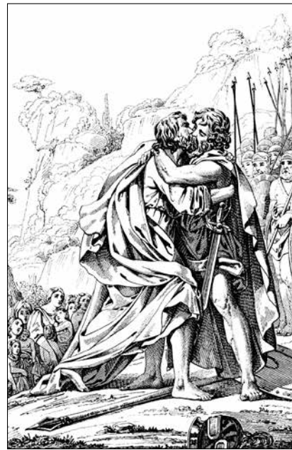
Jakob und Esau: Zweikampf oder Versöhnung und Frieden?

Es geschieht das Unerwartete. Jakob siegt in jener Nacht und der Fremde bittet ihn, ihn loszulassen. Da stellt Jakob eine Forderung, die auf den ersten Blick verwegen erscheint: «Ich lasse dich nicht los, wenn du mich nicht segnest.» Jakob ergreift jetzt also die Chance und geht