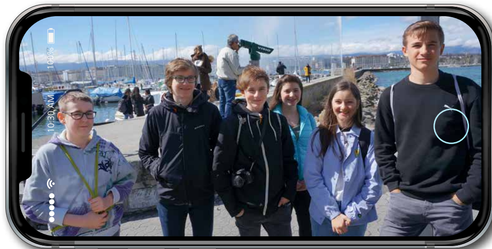
Übernehmen Verantwortung für sich selbst: Konfirmandinnen und Konfirmanden des Gemeindegemeinschafts Stans während ihrer Konf-Reise in Genf. Dominik Flüeler