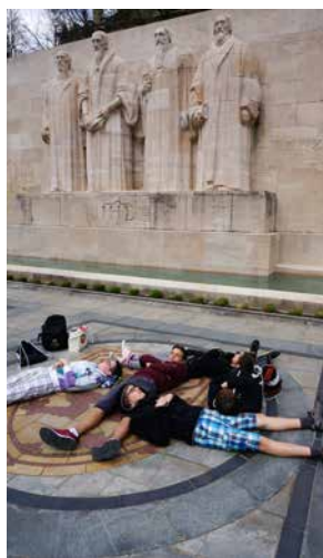
Den vier Reformatoren zu Füssen liegend.