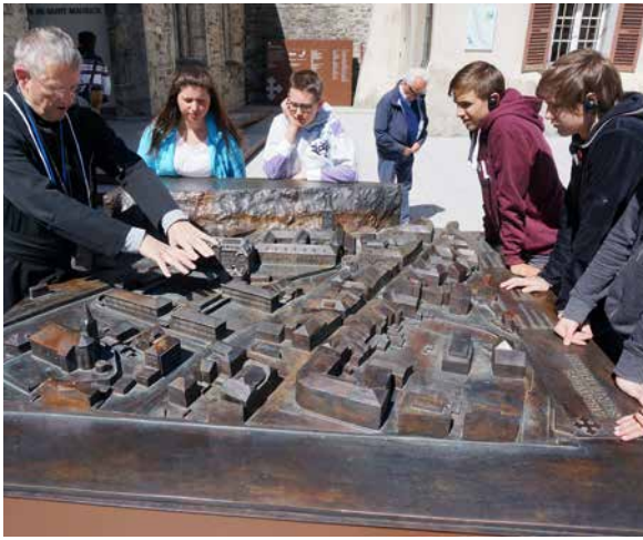
Der lebhaft erzählende Pater erklärt die Entwicklung des Klosters St. Maurice.